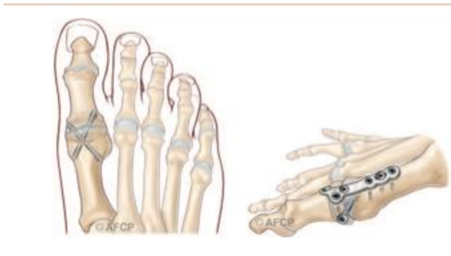
Exemples de fixation d'arthrodèse

Au cours de l'intervention, votre chirurgien peut se trouver face à une situation ou un événement imprévu ou inhabituel imposant des actes complémentaires ou différents de ceux qui étaient prévus initialement. Une fois réveillé et l'intervention terminée, la démarche de votre chirurgien et les actes réalisés vous seront expliqués.